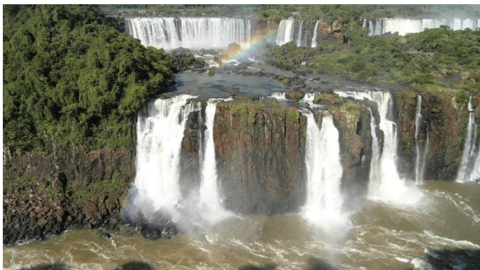
Iguacù - Cascate dell'Iguazú