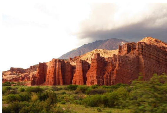
Salta - Quebrada de Humahuaca