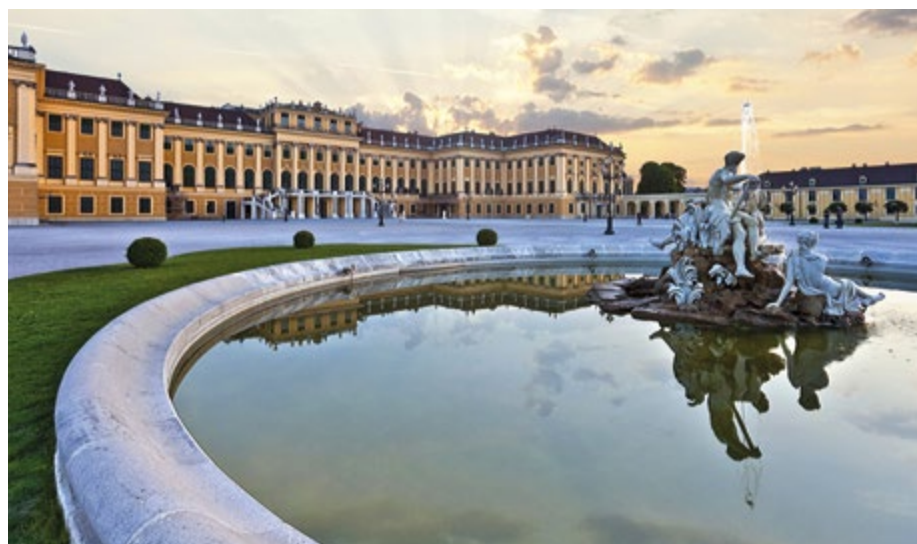
Tabella quote a pag. 35

Trasferimento in aeroporto per il volo di rientro in Italia.